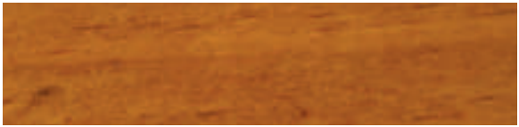
Roble Oscuro A38N40