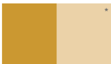
Amarillo Óxido L61YSA1