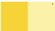
Amarillo Limón L61YSA2