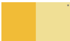
Amarillo Medio L61YSA3