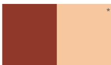
Dorado Rojizo L61NSA1