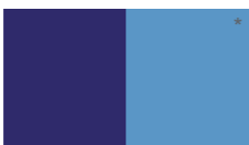
Azul Rojizo L61LSA3