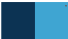
Azul Verdoso L61LSA4