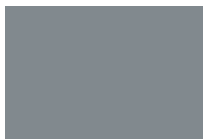
Gris | Y24ASA1