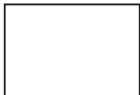
Blanco | Y24WSA1