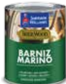
Barniz Marino (A67V4)

Consulte a su distribuidor autorizado Sherwin-Williams en: