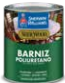
Barniz Poliuretano 1 componente (Línea V82)